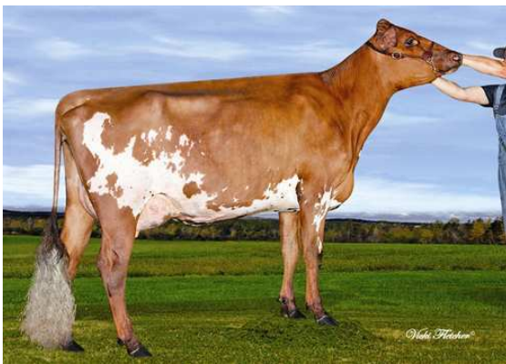
DE LA PLAINE PRIME PLAYA