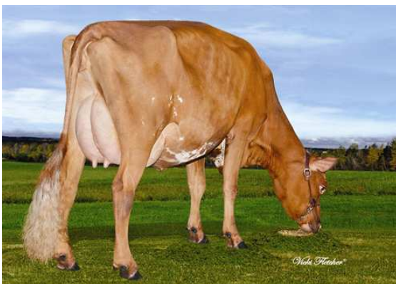
DE LA PLAINE PRIME COOKIE